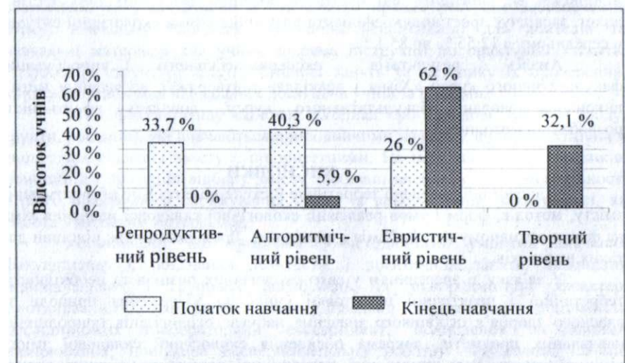
Рис. 2. Зміна характеру пізнавальної діяльності учнів на початку та наприкінці навчання на факультативі