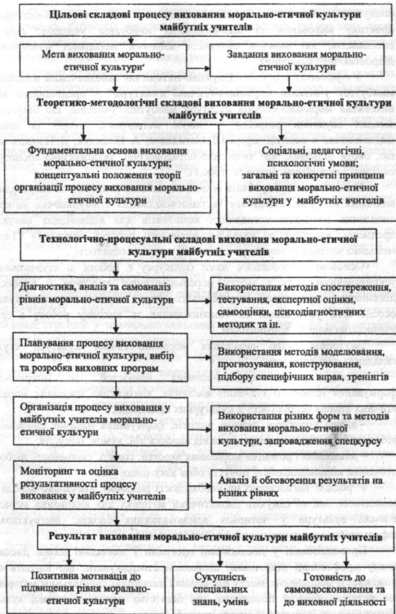
Рис. 1. Модель виховання морально-етичної культури майбутніх учителів

Доведено, що передумовою виховання морально-етичної культури майбутніх учителів у процесі професійної підготовки є глибоке усвідомлення значень морально-етичних понять, цінностей педагогічної професії. Особлива роль при цьому належить таким дисциплінам, як "Загальна педагогіка", "Вступ до спеціальності", "Вікова психологія", "Етика соціально-педагогічної діяльності", "Історія педагогіки", "Методика виховної роботи", "Основи педагогічної майстерності", "Історія України", "Етика та естетика", "Філософія", "Культурологія", "Релігієзнавство" та ін. У розділі представлено методики, що можуть використовуватися у позааудиторній роботі ("Зведення золотих мостів", "Дзеркала Любові", "Боулінг-рішення", "Дієз-вчинки", "Емоційна кориди", "Авторитет", "Кроки до справедливості" тощо), наведено вправи для рефлексії морально-етичного досвіду.