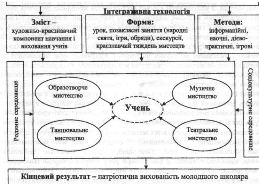
Рис. 1. Модель патріотичного виховання молодших школярів засобами художнього краєзнавства