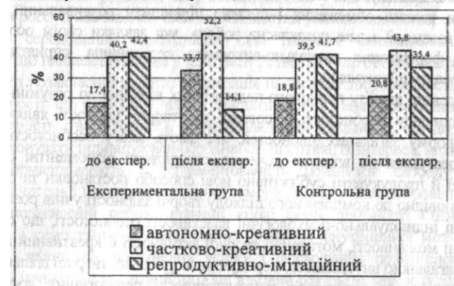
Рис. 1. Динаміка рівнів сформованості творчих здібностей учнів контрольної й експериментальної груп (у %)

відбулися статистично значущі кількісні та якісні зміни за всіма критеріями сформованості творчих здібностей (ціннісно-мотиваційним, особистісно-диспозитивним і когнітивно-операційним), що виявилось в позитивній динаміці загальних рівнів сформованості творчих здібностей (рис. 1).