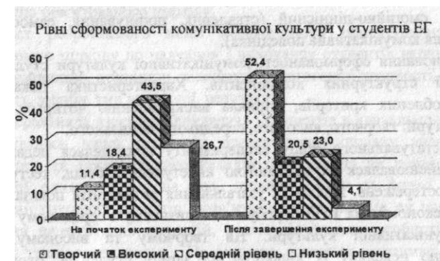
Рис. 2. Динаміка рівнів сформованості комунікативної культури студентів експериментальних груп

У підсумковому контрольному зрізі виявлено, що в експериментальних групах (рис. 2). відбулися помітні зрушення.